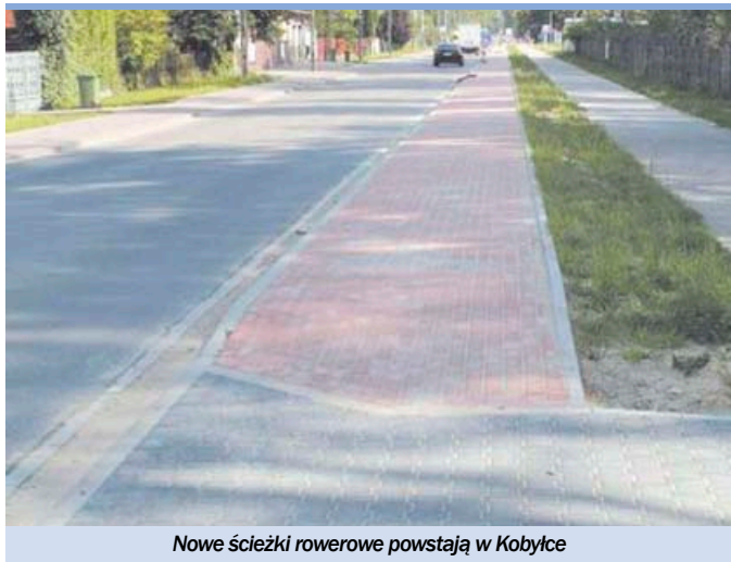
Nowe ścieżki rowerowe powstają w Kobyłce

W ramach spójnej sieci powstana następujące trasy (w postaci ścieżek rowerowych i ciągów pieszo - jezdnych) dla rowerzystów: • trasa wschód - zachód - Żalskiego - Zagańczyka - Marecka - Dworowska (ciąg powiatowy od granicy z Wołominem do granicy z Markami); • trasa północ-południe - Radzyńska - Kościelna - Napoleona - Poniatowskiego (od granicy z Radzyminem do granicy z Zielonką); • trasa Przyjacielska - Serwitucka (od węzła S8 do ul. Napoleona); • trasa wzdłuż linii kolejowej E75 - Warszawska - Ossowska - Nadarzyn - przejazd Kobyłka Ossów - wzdłuż linii kolejowej do Glinianek (od granicy z Wołominem do granicy z Zielonką); • trasa Orszagh - tunel PKP Kobyłka - Bohaterów Ossowa (od Żalskiego do granicy z Wołominem); • trasa Nadarzyn - Orzeszkowej (od Poniatowskiego do Bohaterów Ossowa); • trasa Kazimierza Wielkiego - Bolesława Chrobrego (od Radzyńskiej do granicy z Radzyminem); • trasa Hubala (od Poniatowskiego do granicy z Zielonką); • trasa 11 listopada - Graniczna (od Żalskiego do Orszagh); • trasa Nadarzyńska DW 634 (od granicy z Wołominem do granicy z Zielonką); • trasa wzdłuż S8 (od Dworowskiej do węzła S8 Kobyłka); • trasa Orłat Lwowskich - ulica bez nazwy - wiadukt PKP Kobyłka Ossów