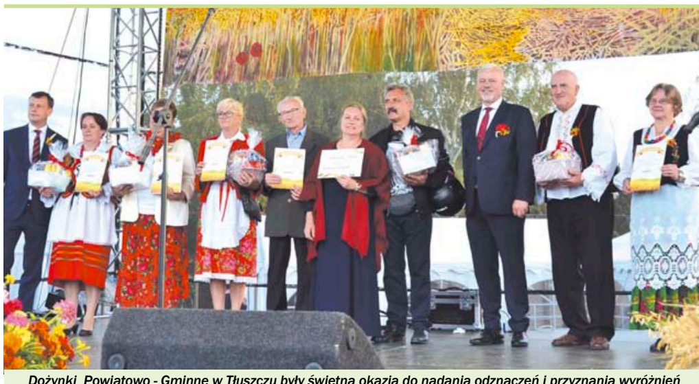
Dożynki Powiatowo - Gminne w Tłuszczu były świetną okazją do nadania odznaczeń i przyznania wyróżnień

odznaczenie powiedziała, że wielokrotnie gościła w Muzeum Ziemi Tłuszczańskiej i bardzo dziękuję wszystkim członkom za pracę na jego rzecz.