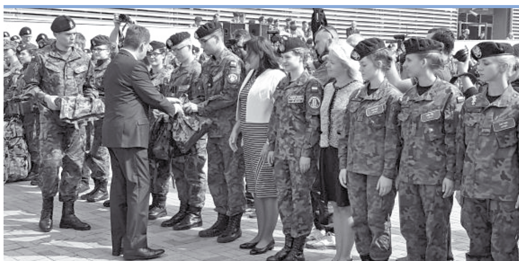
Minister Błaszczak wręczył nagrody uczniom Liceum Ogólnokształcącego im. Bitwy Warszawskiej 1920 roku z Urli

Uroczystość połączona była z wręczeniem nagród laureatom dwóch konkursów: przeprowadzonego po raz trzeci konkursu fotograficzno-filmowego „Zoom na Probronność” oraz realizowanego we współpracy z Wojskowym Centrum Edukacji Obywatelskiej i adresowanego do szkół objętych pilotażem projektu patriotycznego „Siła w Tradycji”. Właśnie w tym drugim Liceum Ogólnokształcącym z Urli zdobyło I miejsce. Nagrody zwycięzcom wręczył Minister Błaszczak. Po uroczystym apelu uczniowie zwrócili się do młodzieży w swoim wystąpieniu szef MON - Mariusz Błaszczak.