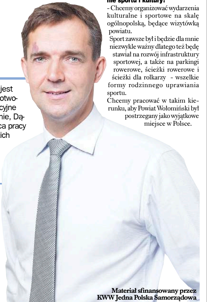
Materiał sfinansowany przez KWW Jedna Polska Samorządowa

- Chcemy organizować wydarzenia kulturalne i sportowe na skalę ogólnopolską, będące wizytówką powiatu. Sport zawsze był i będzie dla mnie niezwykle ważny dlatego też będę stawiał na rozwój infrastruktury sportowej, a także na parkingi rowerowe, ścieżki rowerowe i ścieżki dla rolkarzy - wszelkie formy rodzinnego uprawiania sportu. Chcemy pracować w takim kierunku, aby Powiat Wołomiński był postrzegany jako wyjątkowe miejsce w Polsce.