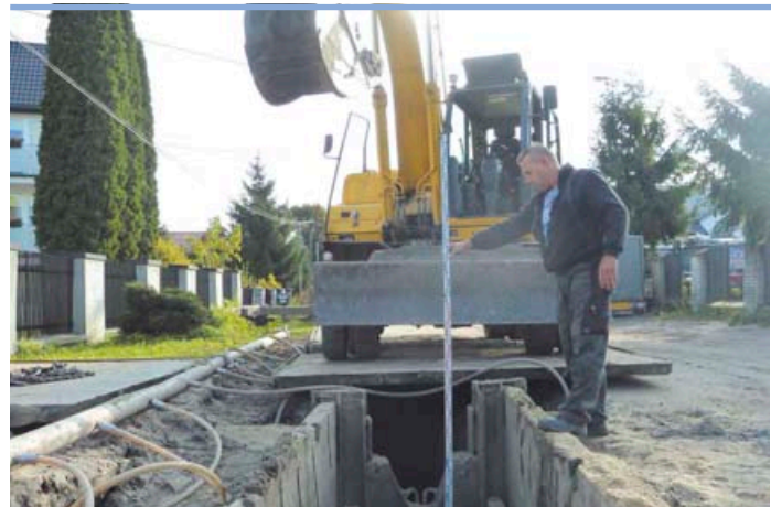
Rozpoczęły się prace przy budowie kanalizacji w ulicy Słonecznej w Lipinkach