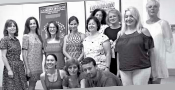
Uczestnicy wyjazdów szkoleniowych będą mogli dzielić się nabytą wiedzą i umiejętnościami z innymi nauczycielami

Podczas pobytu nauczyciele byli zakwaterowani w rodzinach goszczących, co dawało możliwość doskonalenia języka angielskiego, poznania zwyczajów mieszkańców i kultury ich krajów. Nauczyciele skorzystali również z bogatej oferty zajęć fakultatywnych, w tym wyjazdów i wycieczek edukacyjnych, które miały na celu poznanie historii i kultury regionów, w których przebywali. Jednym z istotnych elementów kursu była obserwacja zajęć w szkole brytyjskiej oraz dyskusje z nauczycielami z Wielkiej Brytanii oraz innych krajów europejskich.