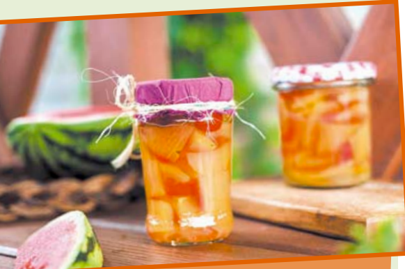
Pikle z arbuza to wspaniały dodatek do wielu potraw

Cytrynę myję, obieram, kroję na cienkie plasterki i usuwam pestki. Obrany ze skórki imbir kroję w plasterki. Przygotowuję zalewę z wody, cukru, octu jabłkowego i przypraw i gotuję ją na niewielkim ogniu około 15 minut od chwili