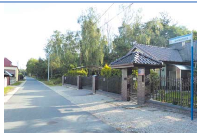
Zakończona inwestycja na jednej z ulic Zakoscińca

Przedsiębiorstwo Wodociągów i Kanalizacji Sp. z o.o. w Wołominie nie zaprzestaje realizacji nowych inwestycji. W ramach podpisanej umowy z NFOŚ i GW rozpoczęta budowa sieci kanalizacji sanitarnej w dwóch lokalizacjach tj. ul. Kochanowskiego oraz Al. Niepodległości w Wołominie. Spółka już dwukrotnie w roku bieżącym ogłaszała postępowania na wybór Wykonawcy. Niestety w pierwszym przetargu oferty przekroczyły zarezerwowane środki, w drugim natomiast żaden wykonawca nie złożył oferty. Obecnie trwają przygotowania do ogłoszenia kolejnego postępowania na wybór wykonawcy dla budowy sieci kanalizacji sanitarnej w wyżej wymienionych ulicach.