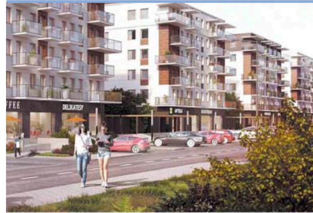
Wizualizacja II etapu inwestycji Kobyłka Dom

Należy pamiętać że II etap inwestycji to wielka szansa dla naszego Miasta na powstanie w tym miejscu swoistego centrum. Powstaną tu lokale gastronomiczne, zakłady usługowe, przedsiębiorcy zadbają również o estetykę tego miejsca, co zdecydowanie zachęci mieszkańców do spędzania wolnego czasu w naszym mieście. Mam na myśli nie tylko miłe spędzanie czasu np. w kawiarni, ale korzystanie docelowo z pięknego parku przy perspektywie poprawy funkcjonowania miejskiej