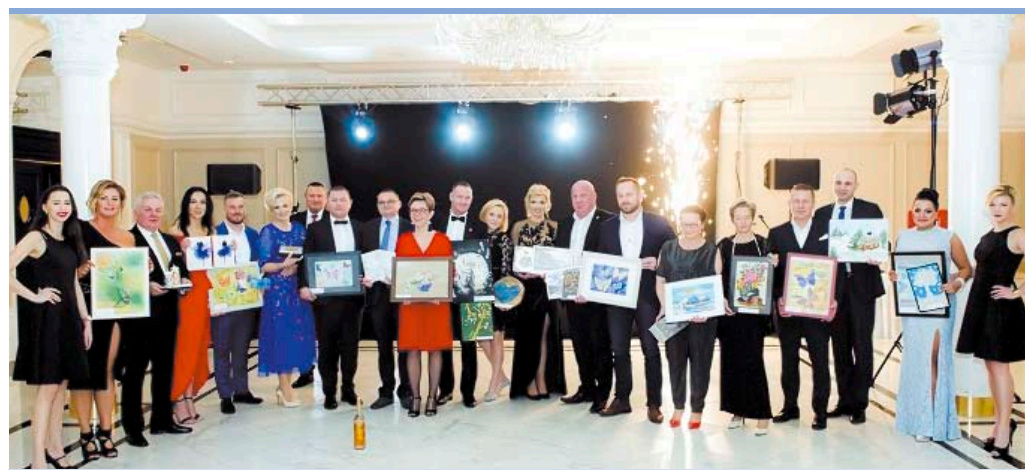
Podczas III edycji Balu Charytatywnego zebrano 24 450 złotych na rzecz ząbkowskich świetlic środowiskowych.

Podczas balu licytowano przedmioty wykonane przez dzieci ze świetlic środowiskowych, a także podarowane przez księgarnię „Orla” w Ząbkach, Przedsiębiorstwo Wodociągów i Kanalizacji w Ząbkach, fotografa Bogdana Śladowskiego i tradycyjnie burmistrza miasta. W trakcie balu poznaliśmy także cztery ząbkowskie firmy nominowane do tytułu Ambasadora Ząbek 2018 wytypowane przez mieszkańców, nominowane przez Kapitułę, ciesząc się uznaniem i rozpoznawalnością.