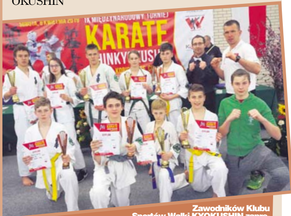
Zawodników Klubu Sportów Walki KYOKUSHIN zaprezentowali podczas zawodów bardzo wysoki poziom.

W nietławą rolę sędziego na zawodach doskonale wpisał się członek