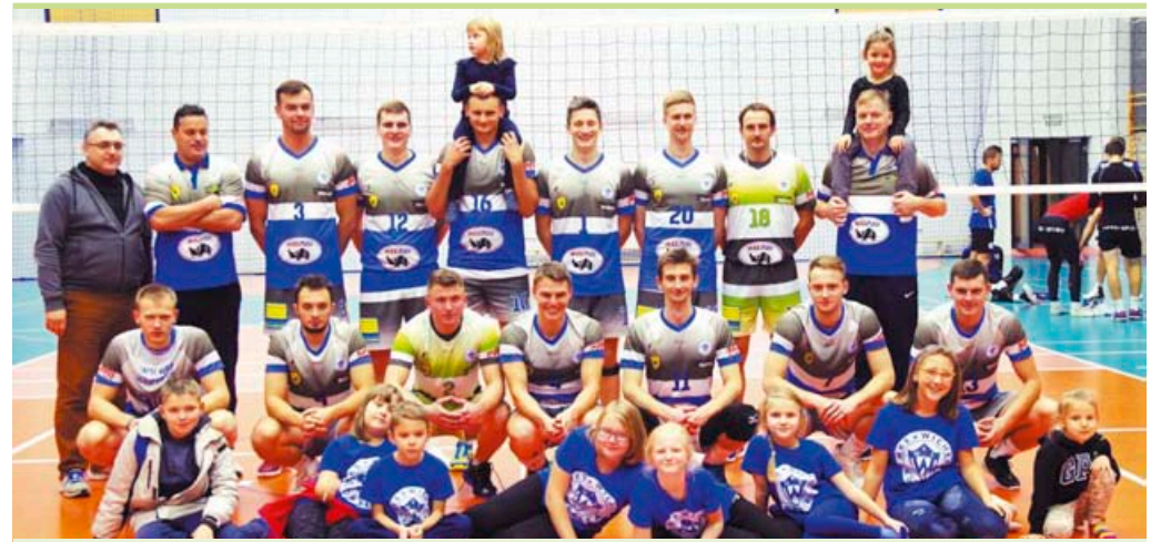
Na turniej półfinałowy siatkarze Wichru Kobyłka pojedą do Turka

– Wywalczyliśmy awans do półfinałów. To jest nasz kolejny krok do przodu. Po pierwszym meczu z Łęczycą mieliśmy spuszczone głowy. Łęczycza nas rozgromiła – i to w tym przypadku jest właściwe słowo. Byli od nas zdecydowanie lepsi w każdym elemencie. Przed decydującym o awansie meczem z gospodarzami byliśmy pełni obaw, bo Gietrzwałd przegrał w pierwszym meczu z Łęczycą tylko 2:3 co oznaczało, że to musi być bardzo dobry zespół. Mecz był pełen walki i "na styku". Do ostatniej piłki nie wiadomo było kto wygra. Zagraliśmy pełni determinacji i to my wytrzymaaliśmy końcówki i zachowaliśmy więcej zimnej krwi. Bardzo cieszymy się