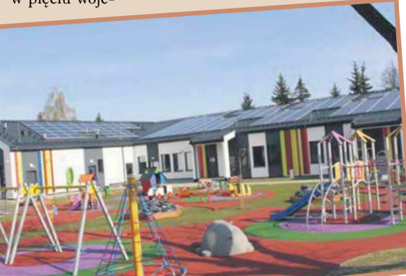
Projekt „Przedszkolaki w zgodzie z naturą” uzyskał dofinansowanie w wysokości 10 tys. zł.