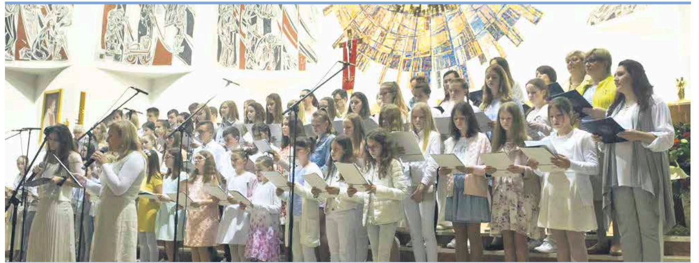
Odbywające się w Żabkach koncerty papieskie dostarczają publiczności ogromu wzruszeń i pięknych przeżyć

Koncerty ku czci Jana Pawła II odbywające się w rocznicę jego kanonizacji zajmują stałe miejsce na mapie wydarzeń kulturalnych w Żabkach. Od wielu lat ich organizatorami są Miejski Ośrodek Kultury i parafia Miłosierdzia Bożego w Żabkach. W przygotowaniu angażują się pedagodzy żabkowskich szkół i rodzice młodszych wykonawców. Dla mieszkańców Żabek koncerty papieskie stanowią nie tylko przeżycie duchowe i artystyczne, ale też pozwalają wspólnie wspominać postać Wielkiego Polaka i pamiętać o jego ciągle aktualnym i ważnym w codziennym życiu przesłaniu.