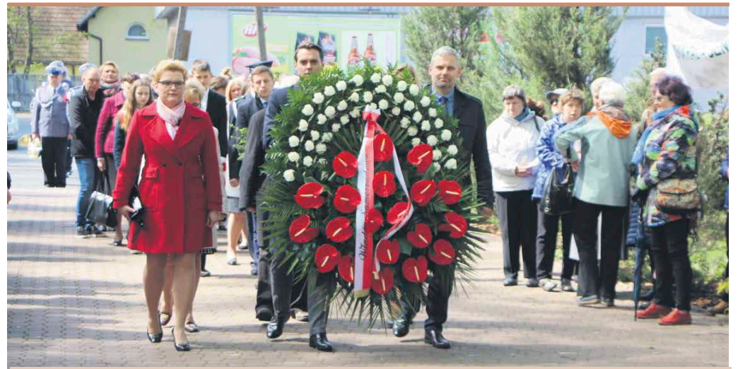
Mieszkańcy Powiatu Wołomińskiego uczcili 228 rocznicę uchwalenia Konstytucji 3 Maja

Obchody w Radzyminie rozpoczęły się odprawną w Ko-