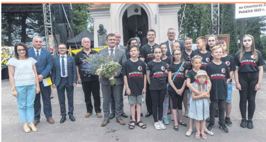
Pamięć o wizycie Jana Pawła II w Radzyminie jest wciąż żywa wśród mieszkańców miasta