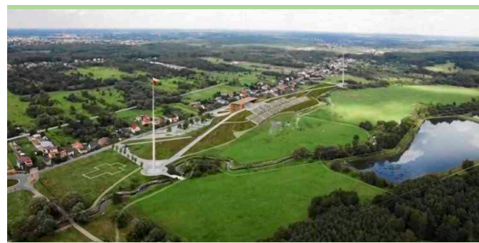
Zagospodarowanie pól ossowskich - czy skończy się tylko na pomysłach?

Choć przygotowana do budowy obiektu upamiętniającego 100 rocznicę Bitwy Warszawskiej w Ossowie trwają już wiele lat (działania w tym kierunku rozpoczął w kadencji 2002 – 2006 ówczesny burmistrz Jerzy Mikulski)