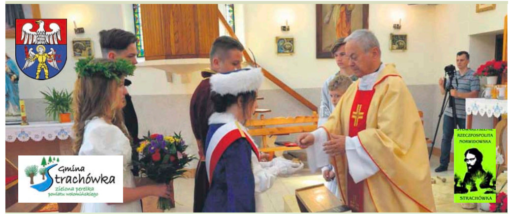
Po raz piętnasty 2 czerwca 2019 r. odbyła się inscenizacja przypominająca zaślubiny rodziców Cypriana Kamila Norwida