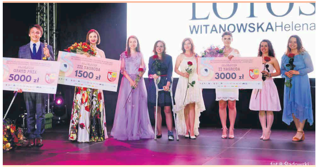
Wręczeniu nagród towarzyszyły ogromne emocje i wielka radość zwycięzców tegorocznej edycji Festiwalu

Szurmieja. Następnie nastąpiło ogłoszenie wyników V Ogólnopolskiego Festiwalu Piosenki Musicalowej im. George'a Gershwin'a o statuetkę „Funny Face”.