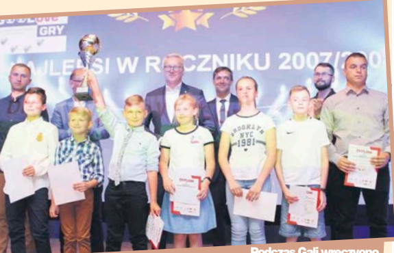
Podczas Gali wręczono Statuetki GOOLSTAR, przyznawane najlepszym zawodnikom danej drużyny, biorącej udział w rozrywkach ligowych,