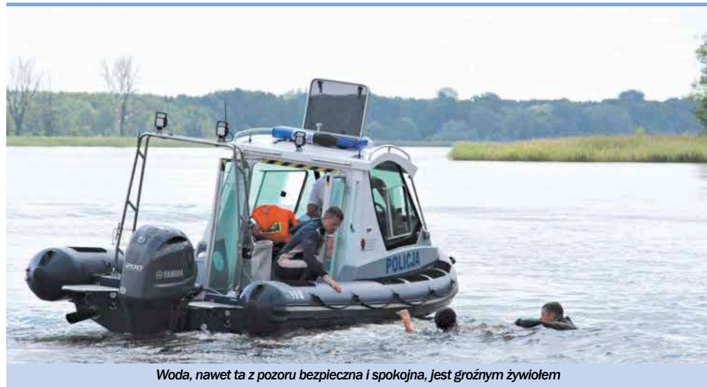
Woda, nawet ta z pozoru bezpieczna i spokojna, jest groźnym żywiołem

nie wolno zdejmować kapoka. W przypadku wyrotki lub nieoczekiwanego wpadnięcia do wody może uratować życie. Żeglarskie powini na bieżąco śledzić prognozy pogody, aby w miarę możliwości unikać zagrożenia związanego z nagłą zmianą aury.