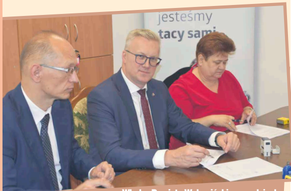
Władze Powiatu Wołomińskiego podpisały umowę na dofinansowanie projektów związanych z likwidacją barier w urzędach i placówkach edukacyjnych

eliminując konieczność korzystania z szatni i opuszczania budynku przez uczniów w celu udania się na zajęcia w sali gimnastycznej. Nastąpi przebudowa i wyposażenie w drzwi automatyczne jednego z wejść do budynku Starostwa przy ul. Legionów (Powiatowe Centrum Pomocy Rodzinie). Wyko-