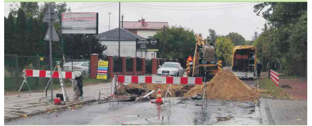
Na ulicach Kobyłki pojawiły się maszyny budowlane. Trwa również modernizacja starych ulic m.in. Ejtnera i Ks. Marmo