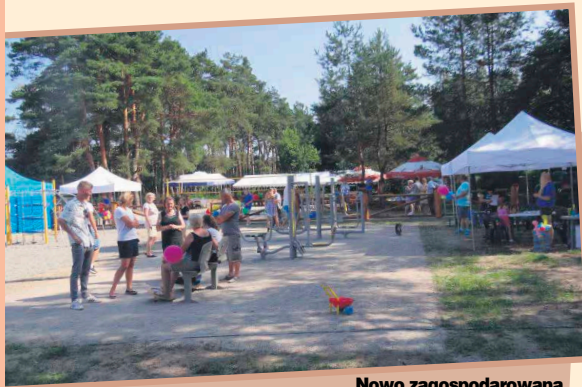
Nowo zagospodarowana przestrzeń będzie służyła wypoczynkowi i rekreacji oraz będzie miała charakter edukacyjny.

elementem są makiety ryb, charakterystyczne dla tego odcinka Bugu i Rządzy. Każda z nich wyposażona jest z tabliczkę, na której oprócz podstawowych informacji znajdują się także ciekawostki dotyczące danego gatunku. Projekt zakłada promowanie turystyki rowerowej w związku z czym przygotowano także miejsce postojowe i naprawy rowerów. Otwarcia towarzyszył pik-