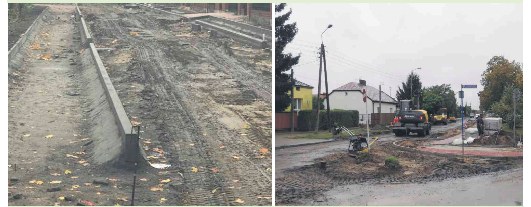
Na modernizację ulic miasto pozyskało dofinansowanie zewnętrzne

Na parkingach przewidziano wiaty rowerowe, z miejscem na ponad 80 rowerów.