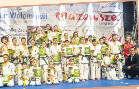
Na KYOKUSHIN Cup przybyło wielu utytułowanych zawodników, aktualnych mistrzów Polski, medalistów Mistrzostw Europy i Świata.