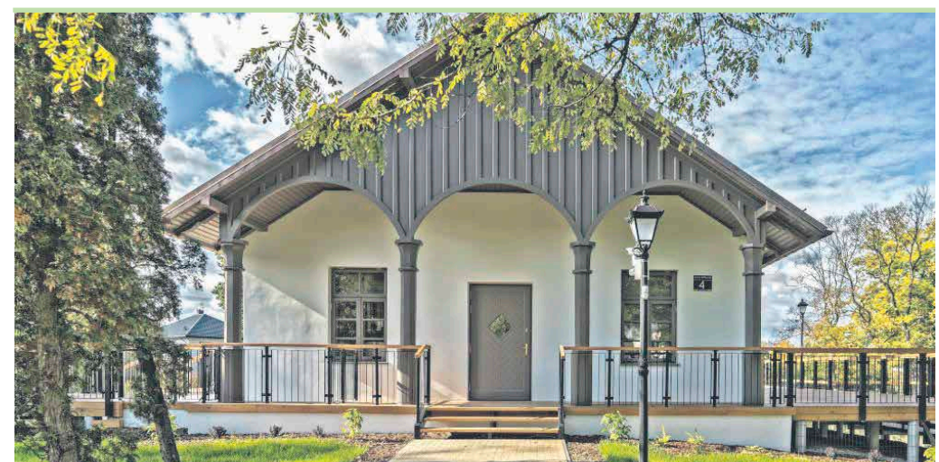
Domku Ogrodnika został pieczołowicie odrestaurowany, z dbałością o XVIII-wieczną konstrukcję i detale.