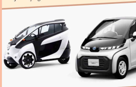
Toyota zaprojektowała ultrakompaktowy samochód elektryczny dla osób starszych, młodych kierowców i lokalnych przedsiębiorców, którzy na co dzień pokonują krótkie dystanse.

Debiut ultrakompaktowego BEV Toyoty wiąże się z nowym modelem biznesowym. Japoński producent chce spopularyzować samochody elektryczne na baterie. Plan zakłada monitorowanie wykorzystania baterii i ich wartości na każdym etapie - od produkcji aż po recykling.