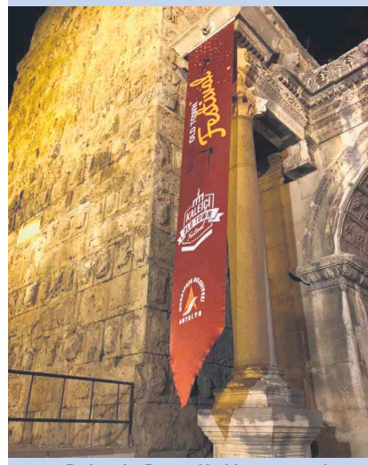
Po lewej – Brama Hadriana, prowadząca na teren dzielnicy Kaleiçi. Uznawana za najpiękniejszy zabytek Antalyi.