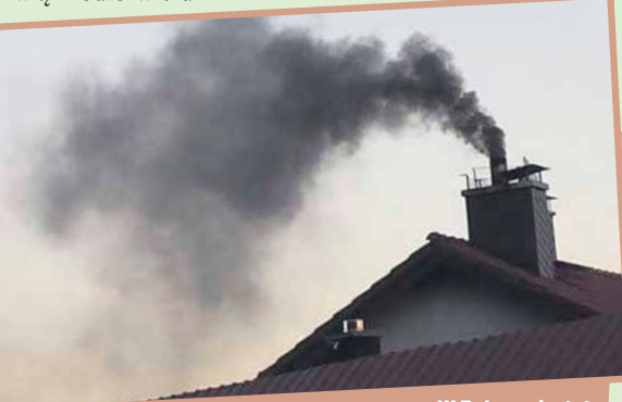
W Polsce niestety nie istnieją normy dla jakości węgla sprzedawanego gospodarstwom domowym.

Główną przyczyną zanieczyszczenia powietrza w Polsce jest "niska emisja", czyli