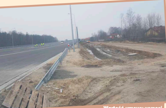
Wartość umowy wynosi ok. 166 mln zł, a czas realizacji to 10 miesięcy od daty zawarcia umowy (z wyłączeniem okresu zimowego).

węzel Zielonka (drogi dojazdowe do węzła), najazdy na wiadukt w ciągu ul. Dworkowej, kładka w rejonie ul. Letniskowej, drogi dojazdowe i pasy technologiczne wzdłuż S8, chodniki, ścieżki rowerowe, Obwód Utrzymywania Drogi, zieleni, prace porządkowe, roboty elektroenergetyczne, teletechnicz-