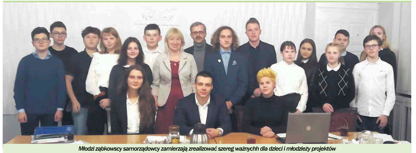
Młodzi ząbkowscy samorządowcy zamierzają zrealizować szereg ważnych dla dzieci i młodzieży projektów

Trzecia kadencja MRM Ząbki rozpoczęła się w październiku 2019 roku. Pierwsza sesja, zaprzysiężenie nowych członków i wybór prezydium miały miejsce w grudniu ubiegłego roku. Pomimo tak krótkiego czasu młodzieżowi radni podjęli szereg działań na rzecz swojego środowiska.