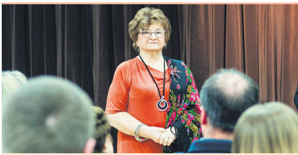
Publiczność z ogromnym zainteresowaniem wysłuchała opowieści o wycinankach

– Nigdy nie używam ołówka. Wycinam od razu, na żywo, a to co jest mi niepotrzebne wyrzucam.