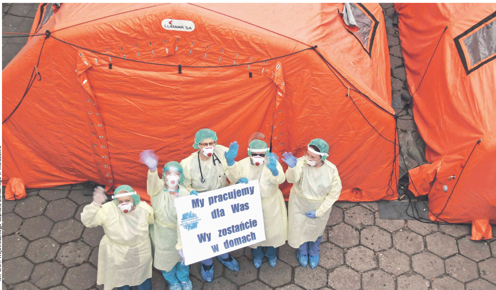
Dzięki unijnemu wsparciu dla Wojewódzkiego Szpitala Zakaźnego w Warszawie samorząd Mazowsza zakupił specjalistyczną aparaturę i środki ochrony osobistej

Samorząd Mazowsza zakupił także niezbędny w walce z ko-