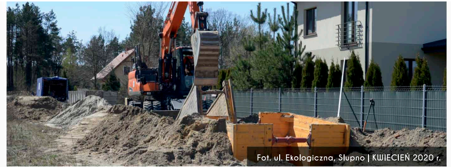
Fot. ul. Ekologiczna, Słupno | KWIECIEŃ 2020 r.

Przedsiębiorstwo Wodociągów i Kanalizacji Sp. z o. o. w Radzyminie w dniu 20 maja 2020r. ogłosiło przetarg na ostatnie zadanie realizowane w ramach Projektu pn. „Budowa kanalizacji sanitarnej i sieci wodociągowej w Gminie Radzymin – Etap II” współfinansowanego przez Unię Europejską w ramach Programu Operacyjnego Infrastruktura i Środowisko 2014-2020.