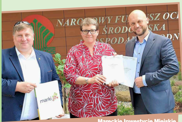
Mareckie Inwestycje Miejskie otrzymały 10,2 mln zł dotacji oraz 15,3 mln zł niskooprocentowanej, preferencyjnej pożyczki.

Wsparcie finansowe NFO-ŚiGW jest dwójakie. Marec-