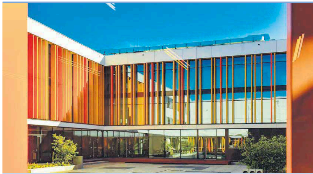
Nanowocześniejsza placówka edukacyjna w Ząbkach oficjalnie otwarta.