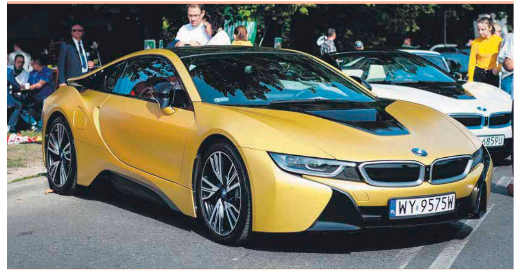
Po raz czwarty Żabki gościły fanów elektro-mobilności z Polski i Europy.