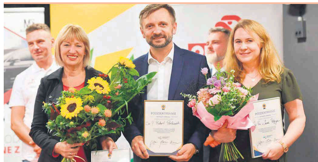
Miłym akcentem konferencji było wręczenie podziękowań osobom zaangażowanym w rozwój elektro-mobilności

W skład zarządu twórczego, którego głównym zadaniem jest organizacja struktur izby oraz pozyskiwanie