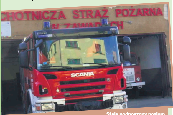
Stale podnoszony poziom wyszkolenia i usprzętowania OSP w Zawadach przekłada się na skuteczność prowadzonych przez jednostkę działań.

Z tego samego źródła udało się także pozyskać 20.000 złotych dofinansowania na zakup agregatu prądowłocznego do działań ratowniczo-gaśniczych.