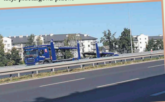
Przewidywane jest dobudowanie nowych lub podwyższenie istniejących ekranów z lewej i prawej strony jezdni oraz w pasie rozdzielającym.

Marki starają się od września 2013 r. Przelomowe znaczenie miały badania poziomu hałasu zrealizowane przez GDDKiA oraz oddzielnie przez miasto już po otwarciu trasy. Poziom hałasu był całodobowo badany w 30 punktach na odcinku 2,7 km od węzła Marki do ulicy Pustelnickiej w Zielonce. Dzienna