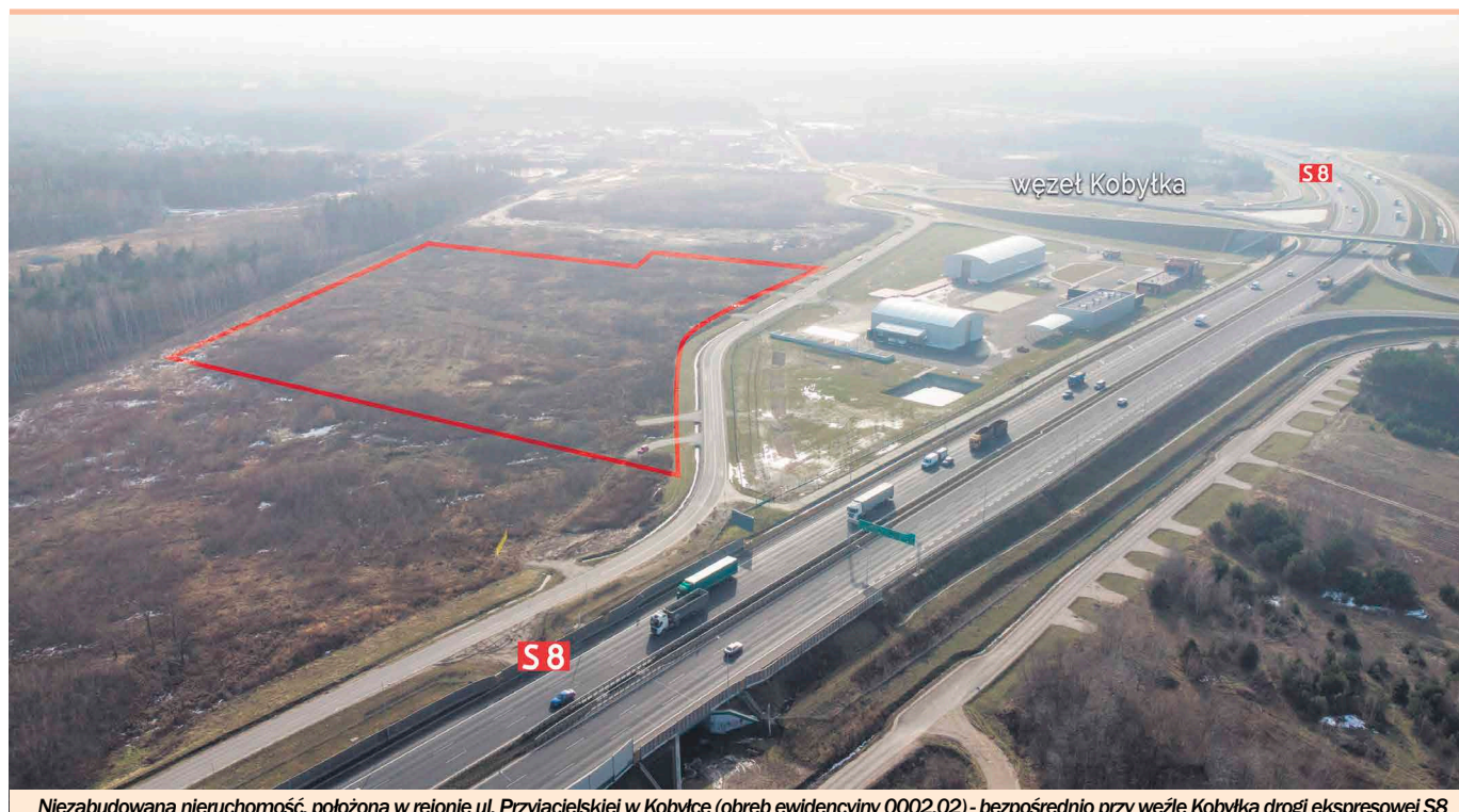
Niezabudowana nieruchomość, położona w rejonie ul. Przyjacielskiej w Kobyłce (obręb ewidencyjny 0002,02) - bezpośrednio przy węźle Kobyłka drogi ekspresowej S8

LzV, LzVI, W i N, nr 9/4 o powierzchni 0,4726 ha, sklasyfikowana jako RVI, PsVI, LzVI i W, nr 10/2 o powierzchni 0,2944 ha, sklasyfikowana jako RVI i LzVI, nr 11/2 o powierzchni 0,1025 ha, sklasyfikowana jako LzVI i nr 12/2 o powierzchni 0,0311 ha, sklasyfikowana jako dr, dla których