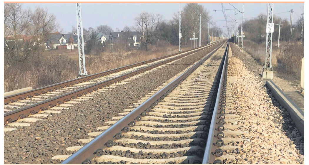
W ubiegłym roku na obszarach kolejowych w powiecie wołomińskim śmierć poniosły cztery osoby

a samochodem osobowym jest taka, jak między pojazdem a puszką z konserwą. Każdy błąd na torach może mieć nieodwracalne skutki, gdyż maszynista nie ma szans wyhamować w ciągu kilku sekund – przestrzegają PKP Polskie Linie Kolejowe S.A., organizator kampanii "Bezpieczny przejazd..."