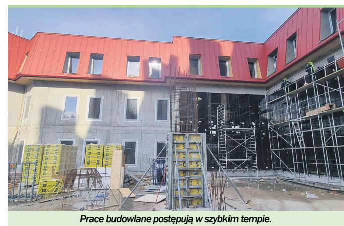
Prace budowlane postępują w szybkim tempie.