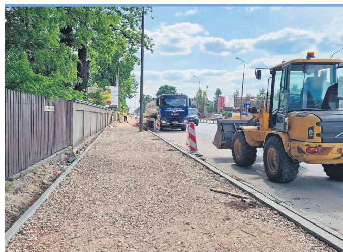
Modernizacja północnego fragmentu Al. Marszałka J. Piłsudskiego w Markach