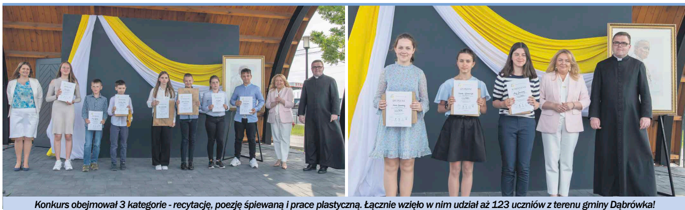
Konkurs obejmował 3 kategorie - recytację, poezję śpiewaną i prace plastyczną. Łącznie wzięło w nim udział aż 123 uczniów z terenu gminy Dąbrówka!

Eliminacje gminne przeprowadziła Szkoła Podstawowa im Jana Pawła II w Guzowatce a organizacji finału podjęły się Gminne Centrum Kultury w Dąbrówce oraz Biblioteka Publiczna przy zaangażowaniu i pomocy Zakładu Gospodarki Komunalnej.