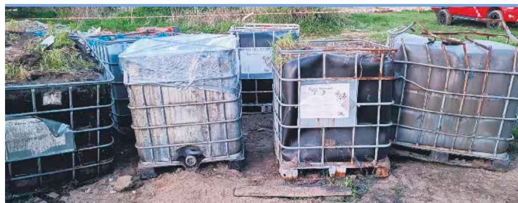
Warto, aby każdy z nas wiedział, że pojawienie się mauserów (pojemników jak na zdjęciu) nie wróży niczego dobrego

przestępstwa przeciwko środowisku, polegającego na składowaniu lub zbieraniu odpadów w takich warunkach lub w taki sposób, że może to zagrozić życiu lub zdrowiu człowieka lub spowodować obniżenie jakości wody, powietrza lub powierzchni ziemi lub zanieczyszczenie w świecie roślinnym lub zwierzęcym (art.183 § 1 ustawy kodeksu karnego).