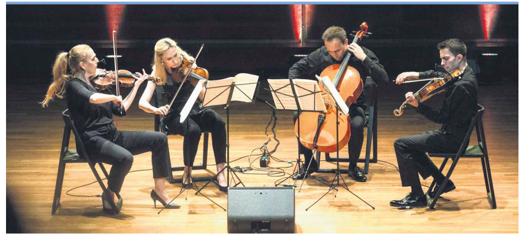
Festiwal otworzy ROYAL STRING QUARTET