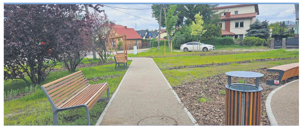
W Żąbkach jest coraz więcej zieleni i stref wypoczynku