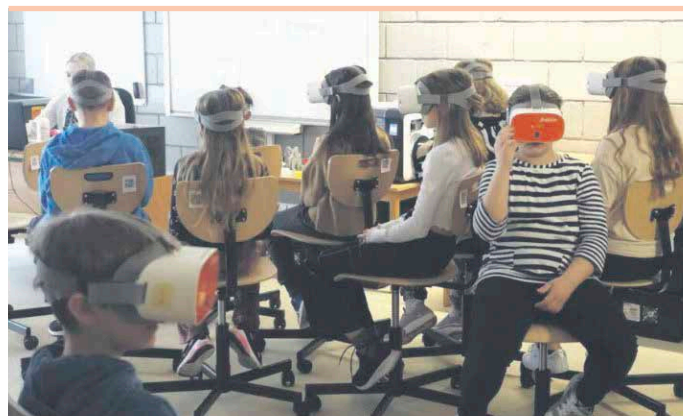
Nauczyciele SP3 w Ząbkach realizują różne innowacje pedagogiczne