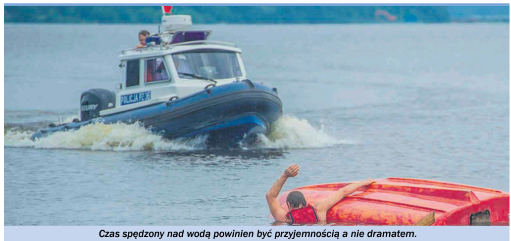
Czas spędzony nad wodą powinien być przyjemnością a nie dramatem.

momentem na pływanie ze względów bezpieczeństwa, a udzielnie pomocy osobie potrzebującej, gdy nie widać gdzie ona się znajduje - staje się wręcz niemożliwe.