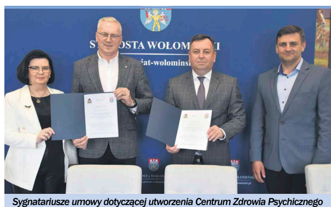
Sygnatariusze umowy dotyczącej utworzenia Centrum Zdrowia Psychicznego

Jak czytamy na stronie starostwa placówka powstanie w budynku należącym do Straży Pożarnej przy ul. Sasina 15 w Wołominie (wejście od strony ul. Gdyńskiej). - Jest to dobrze znane miejsce mieszkańcom stolicy naszego powiatu - funkcjonowały tutaj do czasu rozbudowy Szpitala Matki Bożej Nieustającej Pomocy w Wołominie m.in. po-