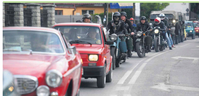
Zlot zaowocował pełnym przekrojem oldtimerów, youngtimerów