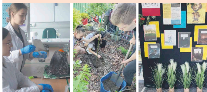
Uczniowie biorą udział w wielu ciekawych zajęciach i konkursach

- zostać ambasadorem nauki”, „Europa i Ja”. Dzięki działalności szkolnego wolontariatu uczniowie mają możliwość angażowania się w aktywne działania w obszarze pomocy koleżeńskiej, społecznej, życia kulturalnego i środowiska naturalnego. Uwzględniając rozwój zainteresowań, uczniowie biorą udział w wielu konkursach m.in. kuratorskich (Kangur Matematyczny, Matematyka bez Granic, Alfik, Puchacz Piotr), ekologicz-