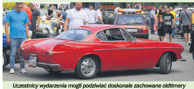
Uczestnicy wydarzenia mogli podziwiać doskonale zachowane oldtimery