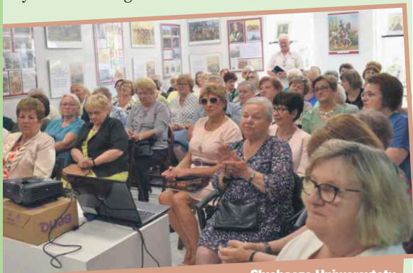
Sluchacze Uniwersytetu Trzeciego Wieku w Tuszczu zakończyli kolejny rok akademicki.