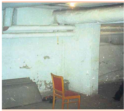
Lokal harcówki TS HORN przed remontem