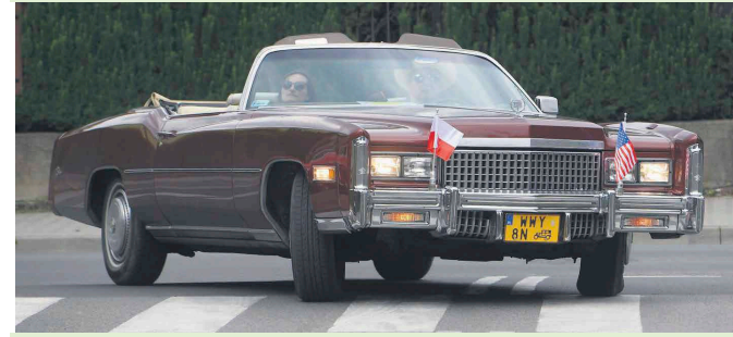
Perelki dawnej motoryzacji po raz piąty zjechały do Ząbek

V Zlot Pojazdów Zabytkowych i Motocykli w Ząbkach zaowocował pełnym przekrojem oldtimerów, youngtimerów i wielu innych ciekawych pojazdów oraz zgromadził liczne grono miłośników dawnej motoryzacji. Wydarzenie było niepowtarzalną okazją do podziwiania zabytkowych samochodów i motocykli, które na co dzień możemy oglądać jedynie w muzeum. Główną atrakcją tegorocznej imprezy był przejazd pojazdów ulicami miasta.