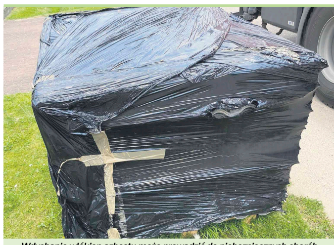
Wdychanie włókien azbestu może prowadzić do niebezpiecznych chorób

- Mając świadomość szkodliwości azbestu na ludzkie zdrowie podejmujemy działania, które mają na celu pozbycie się go z Państwa nieruchomości. Co roku na terenie gminy prowadzona jest nieodpłatna zbiórka odpadów budowlanych zawierających azbest. Jeśli chcesz skorzystać z tej usługi konieczne jest złożenie w Urzędzie Miejskim wniosku o odbiór i utylizację azbestu. Zdemontowany azbest należy ułożyć na palety i ofoliować. Paleta musi być ustawiona na utwardzonym podłożu w miejscu dostępnym do przetransportowania. Niezbędne informacje znajdują się na stronie https://www.tluszcz.pl/strona-3428-utylizacja-azbestu.html - informuje Urząd Miasta w Tłuszczu.