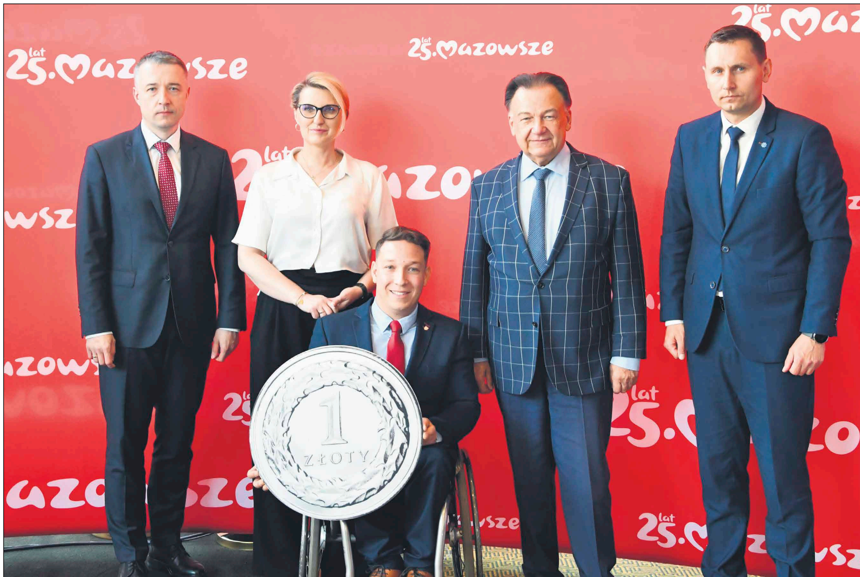
Do odwiedzenia marszałkowskich teatrów i muzeów zachęcali podczas konferencji prasowej przedstawiciele samorządu Mazowsza, Mazowieckiego Centrum Polityki Społecznej oraz instytucji kultury

Trwa druga edycja programu „Kulturalna szkoła na Mazowszu”. Dzięki inicjatywie samorządu województwa mazowieckiego już około 310 tys. uczniów ze szkół podstawowych i ponadpodstawowych odwiedziło marszałkowskie muzea i teatry za symboliczną złotówkę.