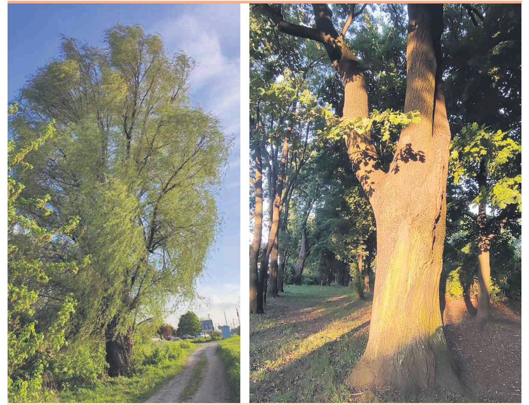
Na mapie Ząbek przybywa drzew objętych ochroną pomnikową.