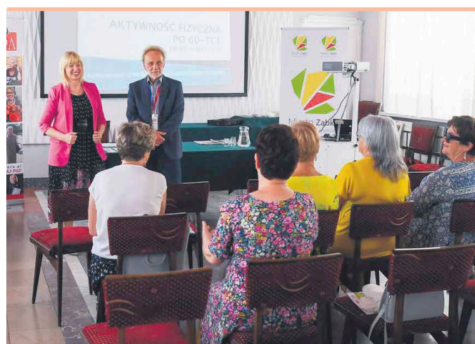
Ogólnopolska Karta Seniora to program uprawniający do zniżek w całej Polsce

Ogólnopolska Karta Seniora to program uprawniający do zniżek w całej Polsce. Każdy senior, który ukończył 60 lat może wyrobić własną bezpłatną i bezterminową Ogólnopolską Kartę Seniora. Karta ta