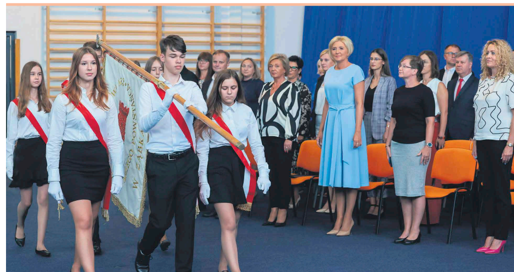
Agata Kornhauser-Duda złożyła dzieciom życzenia na nowy rok szkolny