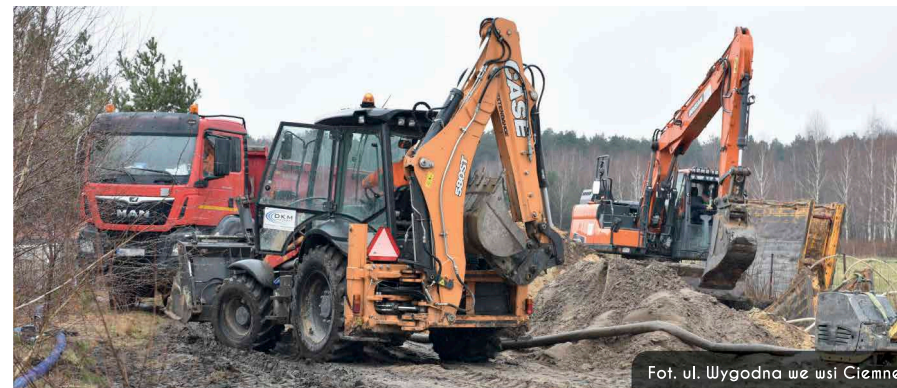
Fot. ul. Wlygodna we wsi Ciemne

Przedsiębiorstwo Wodociągów i Kanalizacji Sp. z o.o. w Radzyminie kończy działania związane z gospodarką wodno-ściekową na terenie Gminy Radzymin w ramach Projektu pn.: „Budowa kanalizacji sanitarnej i sieci wodociągowej w Gminie Radzymin – Etap II” dofinansowanego ze środków Unii Europejskiej.