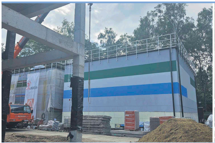
Budowa SUW "Południe" idzie pełną parą