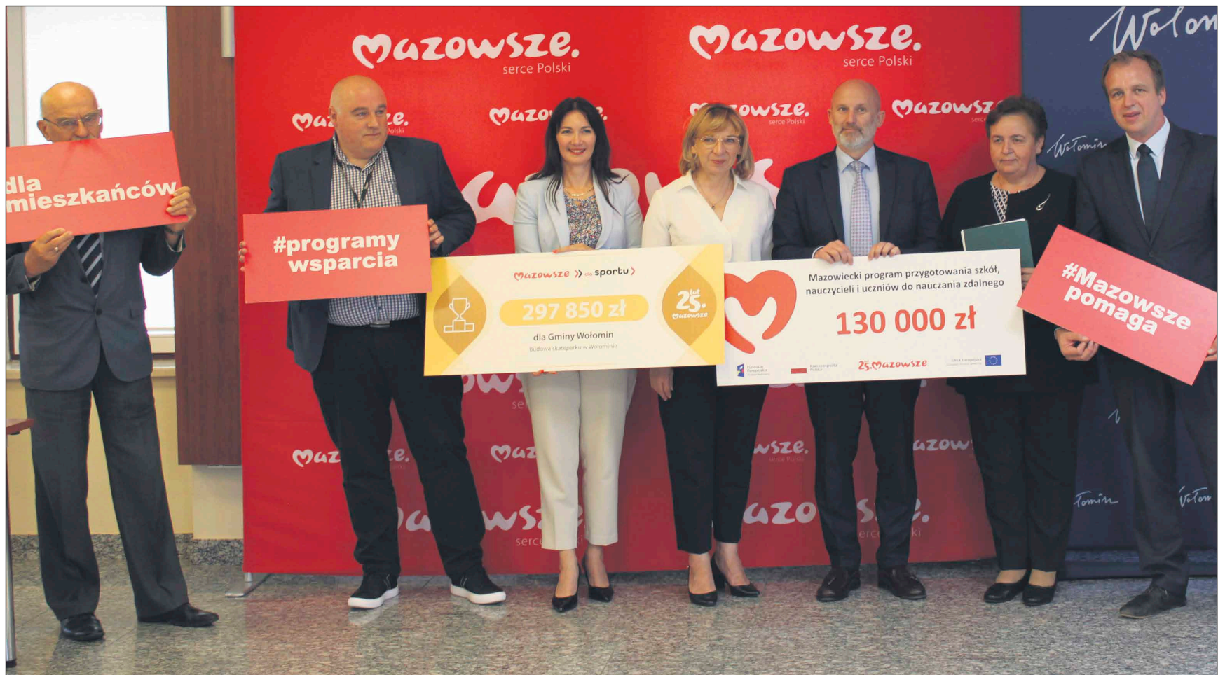
Dofinansowanie z sejmiku Mazowsza pozwoli m.in. na budowę skateparku w Wołominie

Światowa Organizacja Zdrowia alarmuje, że dzieci w Polsce tyją najszybciej w Europie. Problem dotyczy aż 32 proc. najmłodszych w wieku 7-9 lat. Skalę widać również lokalnie. Badania pokazują, że na występowanie nadwagi i otyłości najbardziej są narażeni uczniowie z województwa mazowieckiego. W profilaktyce i leczeniu dużą rolę odgrywa ruch, dlatego sejmik Mazowsza szuka rozwiązań, aby zachęcić mieszkańców do aktywności fizycznej. Jednym z nich jest dofinansowanie budowy lub remontu boisk, sal gimnastycznych czy hal sportowych.