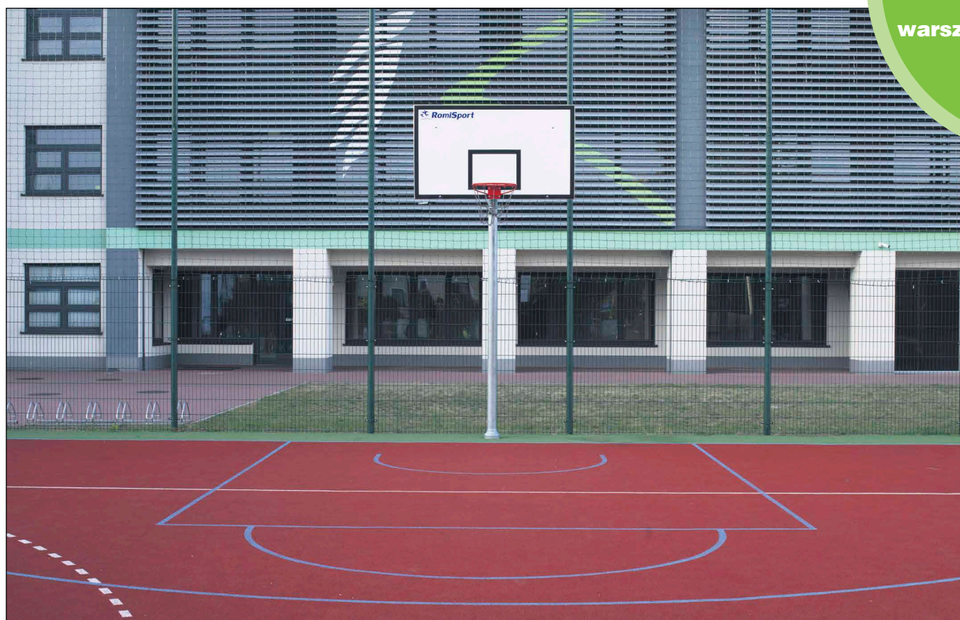
Budowa boiska przy Szkole Podstawowej nr 3 w Kobyłce to efekt realizacji programu „Mazowsze dla sportu”

Program już przynosi wymierne efekty w postaci lepszego dostępu do różnego rodzaju rekreacji i nowoczesnej infrastruktury nie tylko w miastach, lecz także na terenach wiejskich. Przekazane środki pomogły samorządom stworzyć całkiem nowe obiekty i poprawić warunki w już istniejących, np. zamontować oświetlenie, wymienić nawierzchnię, dobudować zaplecze sanitarno-szatniowe itp.