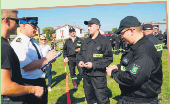
Pierwsze miejsce zdobyła jednostka OSP Roszczep, drugie OSP Klembów, a trzecie OSP Krusze.