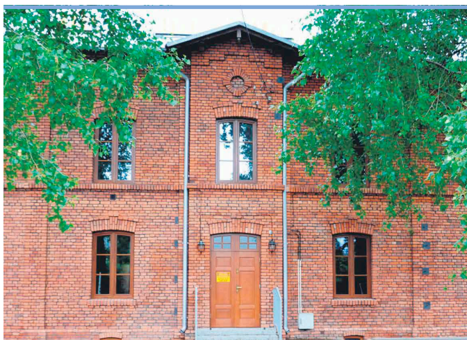
Renowacja kamienicy została doceniona na szczęblu wojewódzkim

- Serdecznie gratuluję i dziękuję w imieniu Samorządu Województwa Mazowieckiego za wkład i zaangażowanie jakie