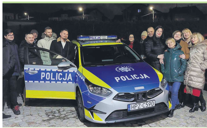
Nowy radiowóz ząbkowskiej policji już trafił do codziennej służby

Doposażenie ząbkowskiego komisariatu w nowy pojazd poprawiło warunki pracy i skuteczność działania funkcjonariuszy, a tym samym przyczyniło się do podniesienia poziomu bezpieczeństwa mieszkańców miasta.