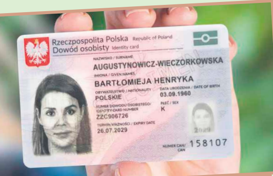
Czas oczekiwania na dowód osobisty wynosi 30 dni od daty uzupełnienia wzoru podpisu i pobrania odcisków.

Wniosek o dowód musi złożyć każdy, kto: ukończył 18 lat i nie ma jeszcze dowodu osobistego; wymienia dowód osobisty np. z powodu zmiany