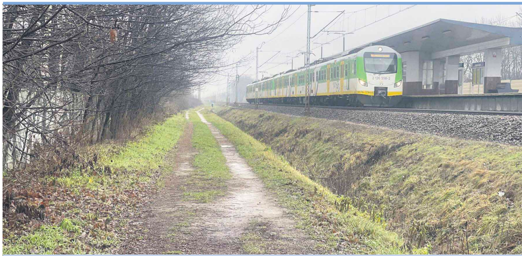
O tym, że trasa wzdłuż torów kolejowych to doskonałe rozwiązanie dla rowerzystów mówi się od dawna. Czy teraz się uda?

Porozumienie o współpracy PKP ze Związkiem Województw RP ma usprawnić budowanie przez samorządy tras rowerowych na obszarach kolejowych. Określono w nim ramy współpracy dotyczące warunków technicznych skrzyżowań linii kolejowych z drogami rowerowymi, a także dróg dojazdu dla rowerzystów i osób o ograniczonej możliwości