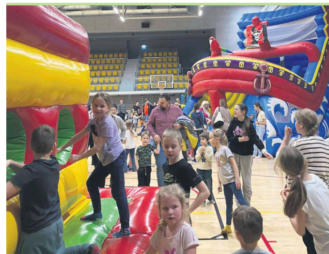
Tylko w ciągu dwóch pierwszych dni ząbkowskiego festiwalu z kolorowych dmuchanych zabawek skorzystało około 1000 osób