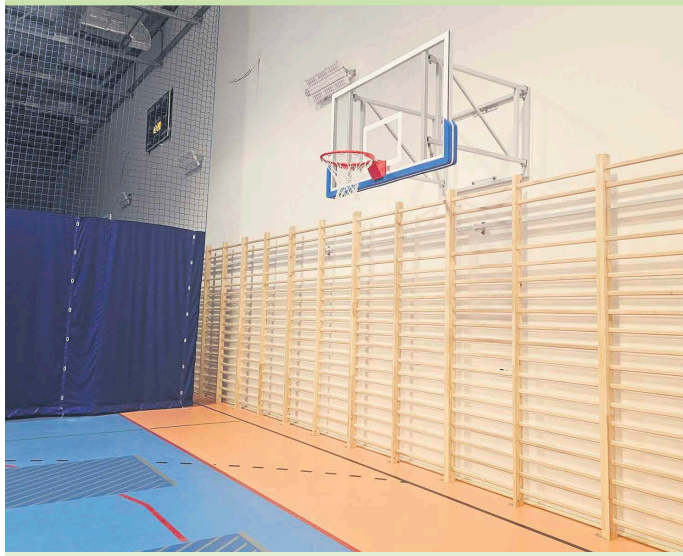
Nowa hala sportowa umożliwi prowadzenie zajęć na najwyższym poziomie