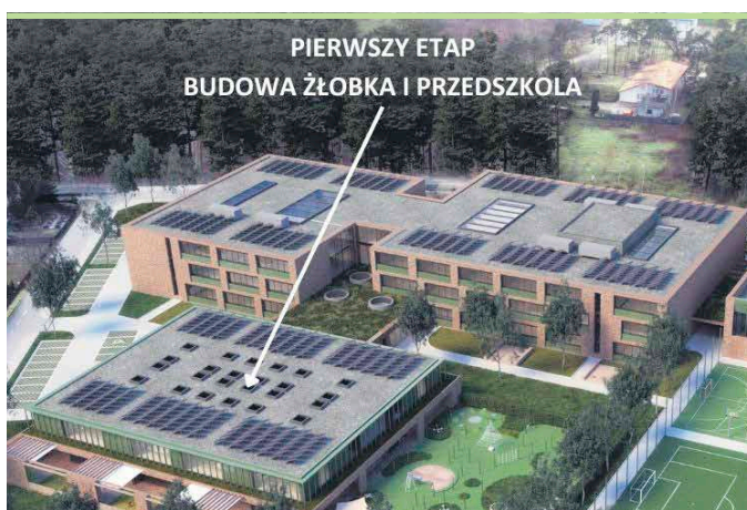
Miejski żłobek to kolejna ważna i potrzebna inwestycja w Markach

Wykonanie projektu żłobka jest niezbędne do tego, by w kolejnym etapie ogłosić przetarg na wykonanie prac budowlanych.