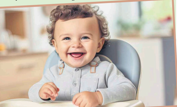
Podatek PIT za rok 2023 będzie podstawą do otrzymania karty mieszkańca i na jej podstawie skorzystania z bonu żłobkowego już za I półrocze 2024 r.

Od stycznia 2024r na wniosek Burmistrz Małgorzata Zysk, funkcjonuje w Ząbkach bon żłobkowy. Bon uprawnia rodziców dzieci do lat 3, do otrzymania zwrotu kwoty 200 zł za każdy miesiąc opieki w niepublicznym żłobku, klubie dziecięcym lub u dziennego opiekuna wpisanych do rejestru żłobków i klubów dziecięcych lub do wykazu dziennych opiekunów prowadzonych przez Bur-