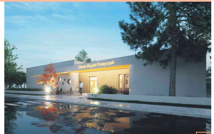
W ciągu ostatnich 5 lat w Ząbkach zrealizowano inwestycje za kwotę 310 milionów złotych z dofinansowaniem ze źródeł zewnętrznych w kwocie blisko 200 milionów złotych.

o Poradni Specjalistycznej dla dzieci! - mówi Burmistrz Ząbek. Ząbki w związku z dynamicznym rozwojem potrzebują dobrej i przyzwoitej infrastruktury drogowej.